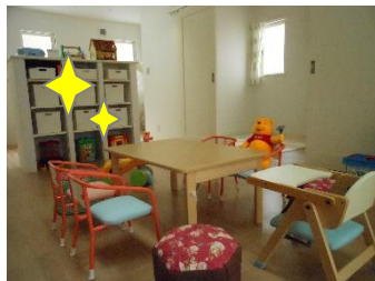
朝の会、給食など 集いの場所

※職員さんは福利厚生で、樹の里から半額の補助を受けています。 ※0～2歳児の無償化対象になる児童は住民税非課税世帯のみです。 ※定員:7名 当園では非正規受入枠を7名様分設けております。