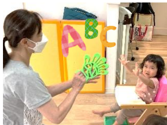
夢中になる英語教室