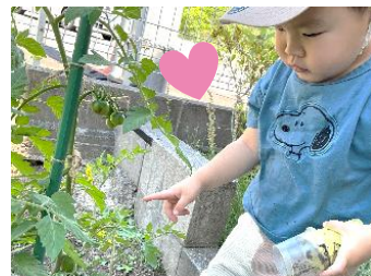
食を営む力の基礎を 培う食育