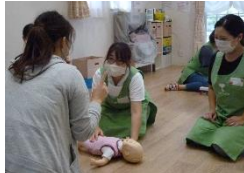
保育士さんの救命講習