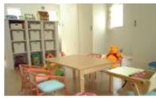
朝の会、給食など集いの場所

※職員さんは福利厚生で、樹の里から半額の補助を受けています。 ※0~2歳児の無償化対象になる児童は住民税非課税世帯のみです。 ※定員:7名 当園では非正規受入枠を7名様分設けております。