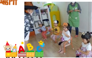
夢中になる英語教室