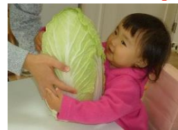
食を営む力の基礎を培う食育